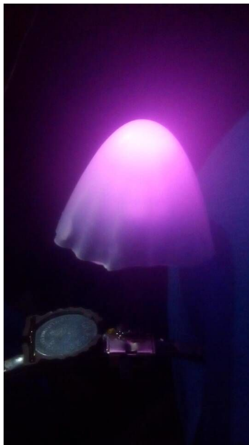
在黑暗中的发光效果

由左图可知，使用的材料很少。我在这里使用了发卡来作为主体材料，同时作为导线。CR1220 锂电池以及配套的电插座，小型拨动开关，LED，6mm 的热缩管（套在 LED 引脚上，可以是黑色也可以是白色、棕色，最好不要有字），还有在 51 电子网上买的光控小夜灯套件（ http://www.51dz.com/0/s---3344-.htm ）中的橡胶蘑菇（套在 LED 上），再用电烙铁以及热熔胶固定，就做成了 LED 夜光萌草。